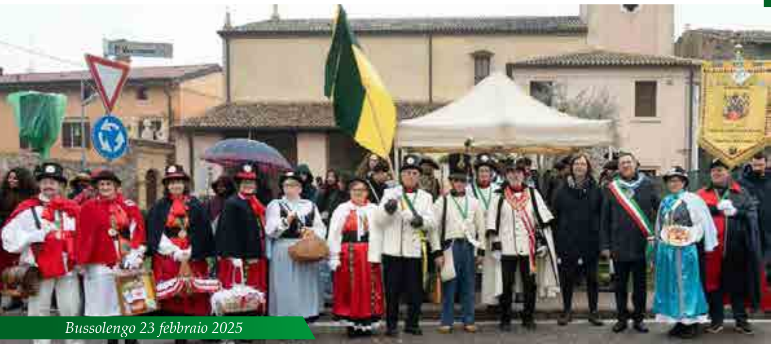
Bussolengo 23 febbraio 2025