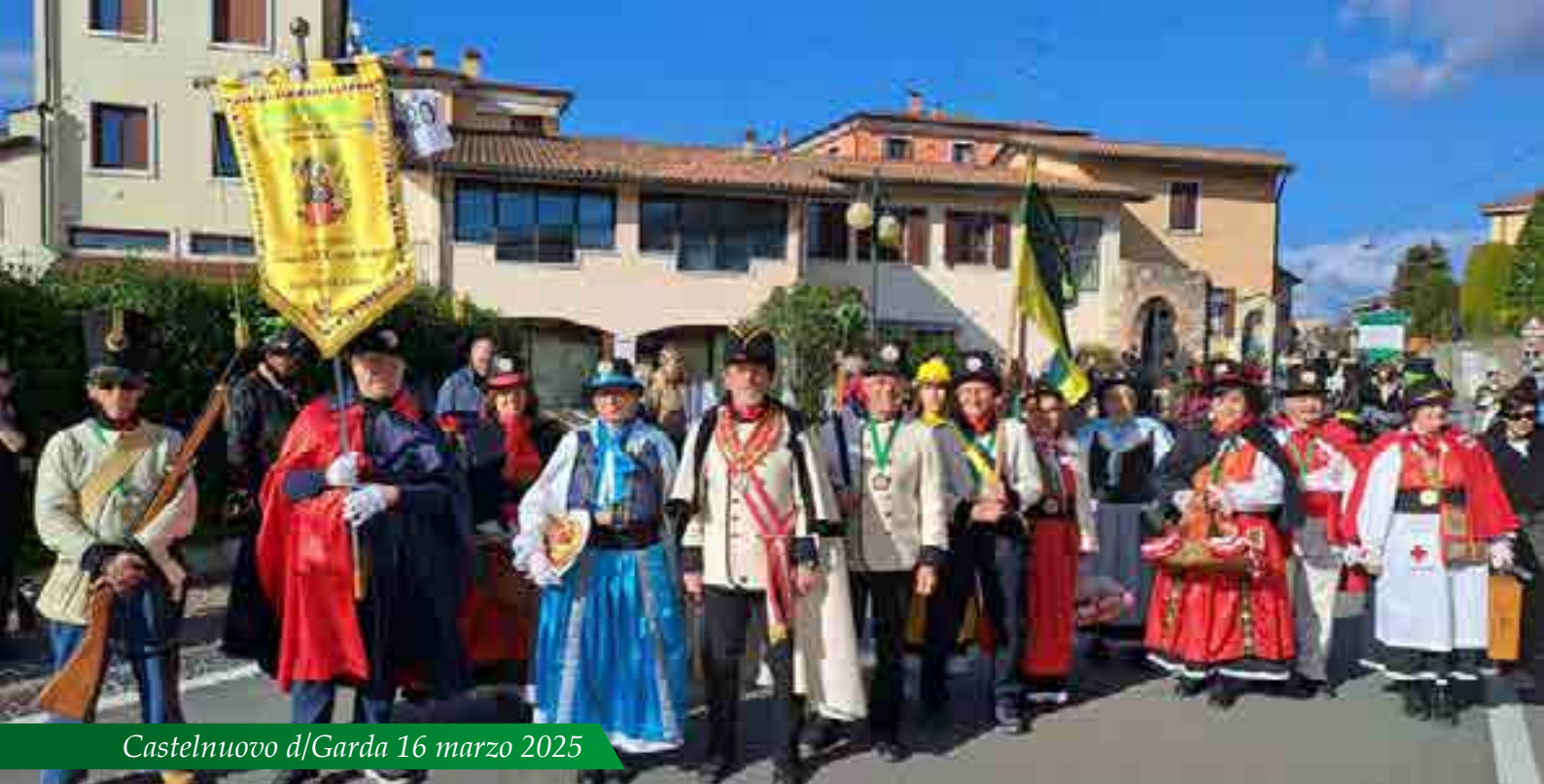
Castelnovo d/Garda 16 marzo 2025