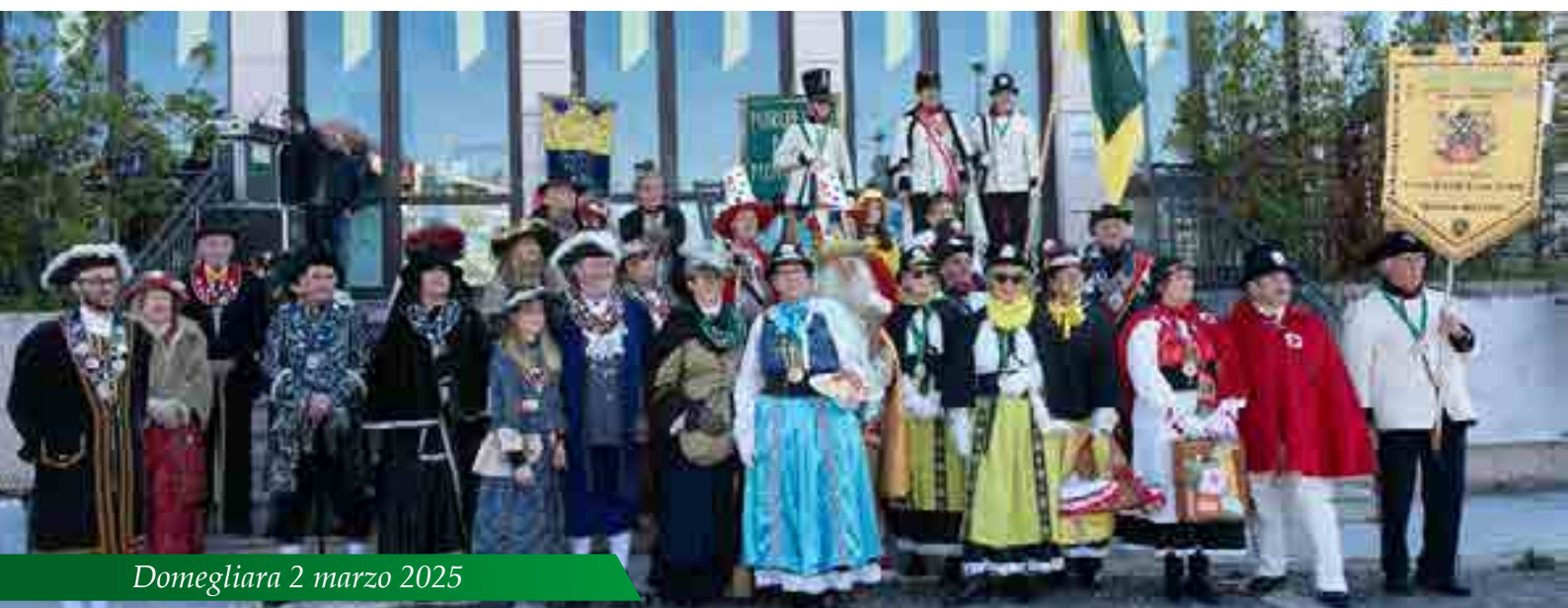
Domegliara 2 marzo 2025