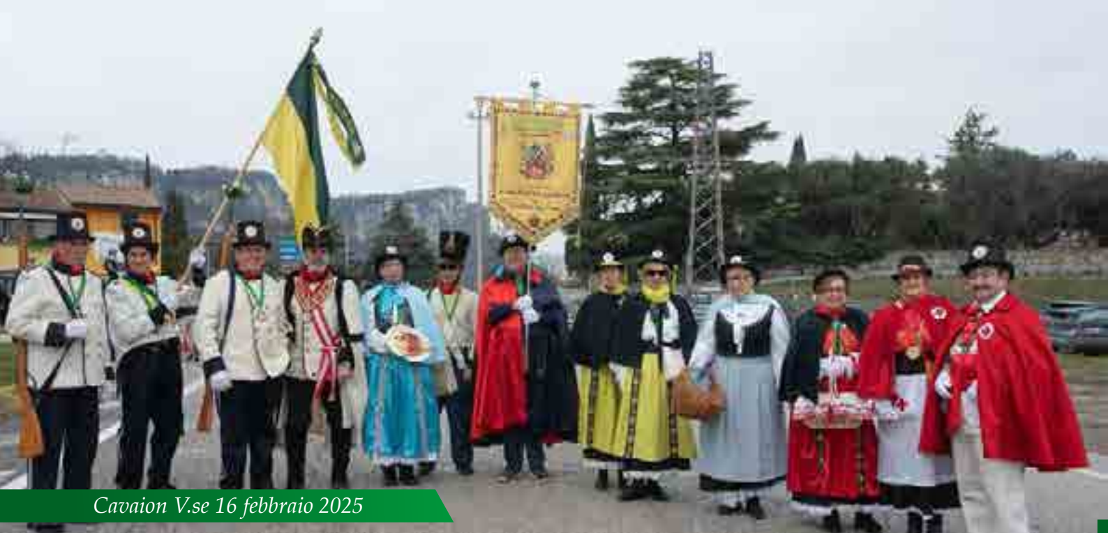
Cavaion V.se 16 febbraio 2025